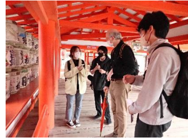
ガイド演習の様子

2回の宮島でのフィールドワークの内、10月16日(日)は実地見学、11月14日(日)は担当教員を外国人観光客に見立ててガイド演習を行いました。