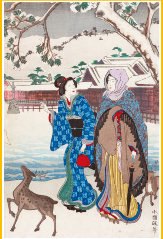
日本三景の内(一～三)